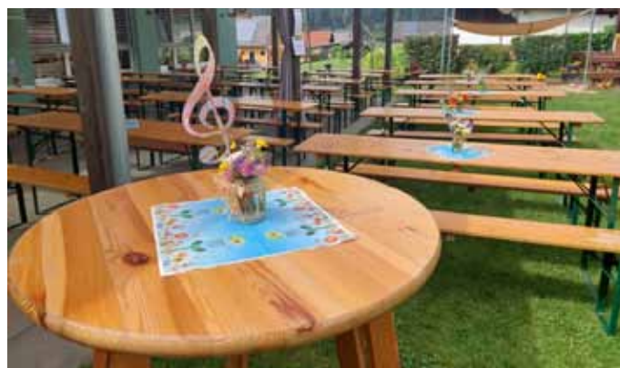
Alles ist bereit für das Sommerfest.