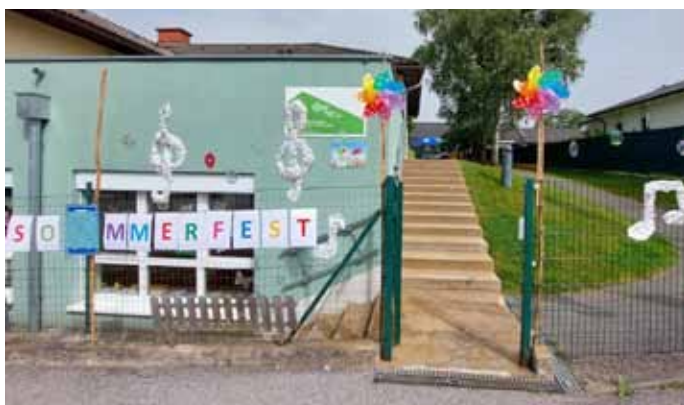
Herzlich willkommen zum Sommerfest!