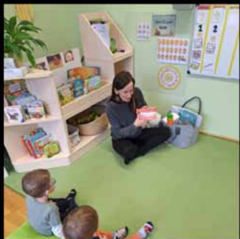
Zahnprophylaxe in der Kinderkrippe