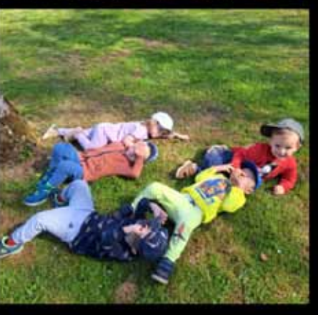
Wir genießen den Frühling mit all unseren Sinnen.