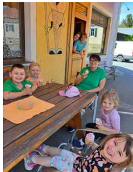
Spaziergang mit Eis essen