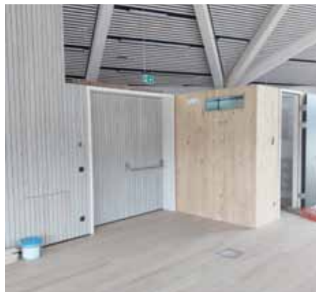
Blickfang zum Sitzungssaal