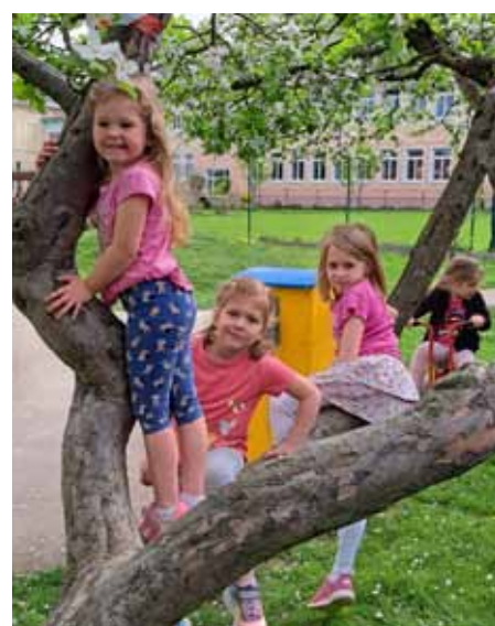
Baum klettern macht Spaß...