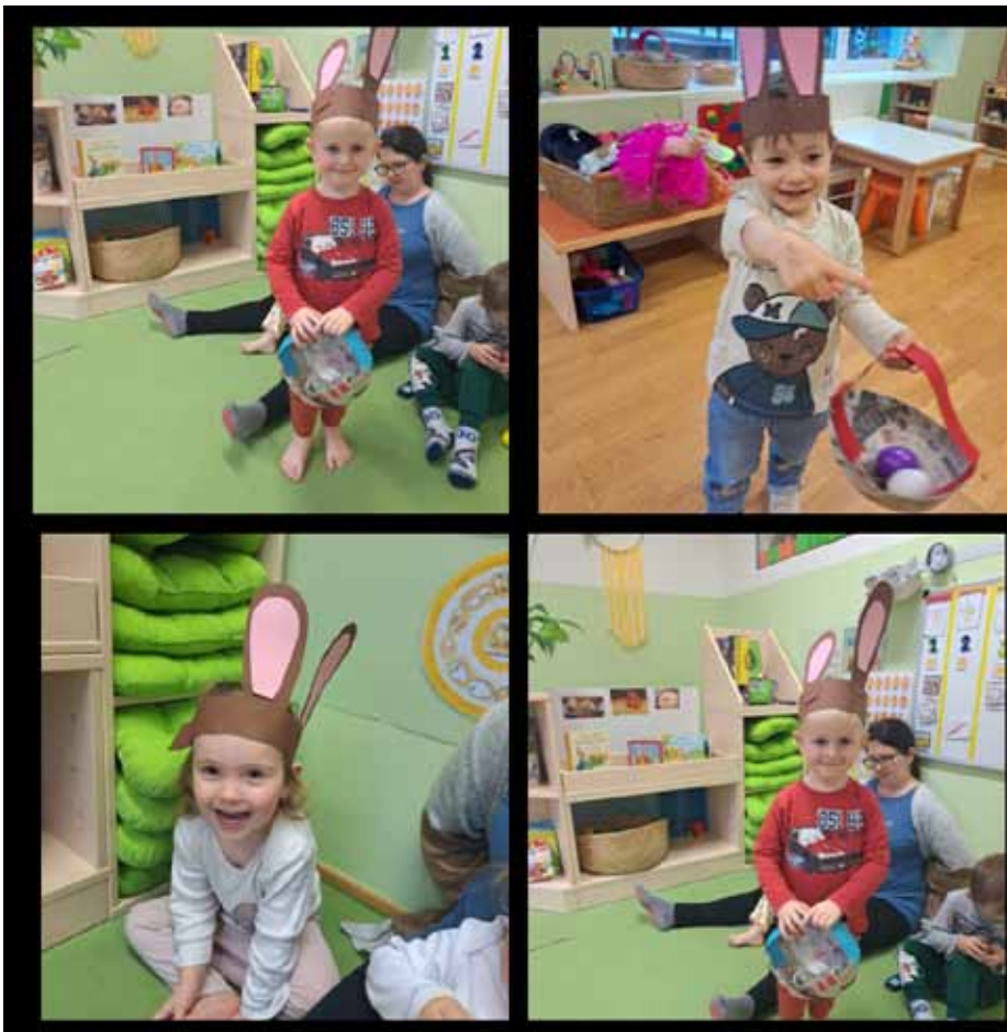
Die kleinen Osterhasen in der Kinderkrippe

Am 22. März kam der Osterhase in den Kindergarten und in die Kinderkrippe. Für die Kinder des Kindergartens versteckte der liebe Osterhase für alle Kinder ein Nestchen am Loamratl und für die Kinder der Kinderkrippe im Garten unserer Einrichtung. Mit vollem Eifer, Freude und Spaß waren die Kinder beim Nesterlsuchen.