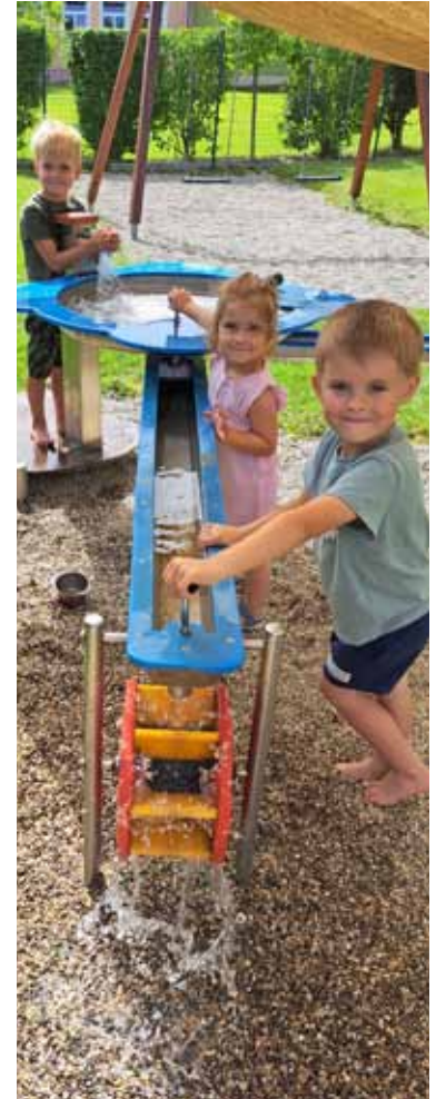
Wasserspiele im Garten