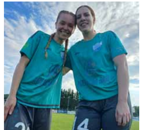
Kapitänin Ciara und unsere Allrounderin Valerie

beendeten wir als Herbstmeister und so war für uns nur ein Ziel vor Augen, wir wollten unbedingt den Aufstieg in die Landesliga schaffen. Bis zum letzten Spiel lachten wir von der Tabellenspitze, jedoch verloren wir leider in Südburgenland nach einer 1:0 Führung knapp mit 1:2! Trotz einiger Tränen und ein we-