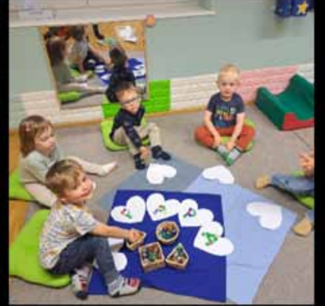
Vorbereitung auf Vatertag