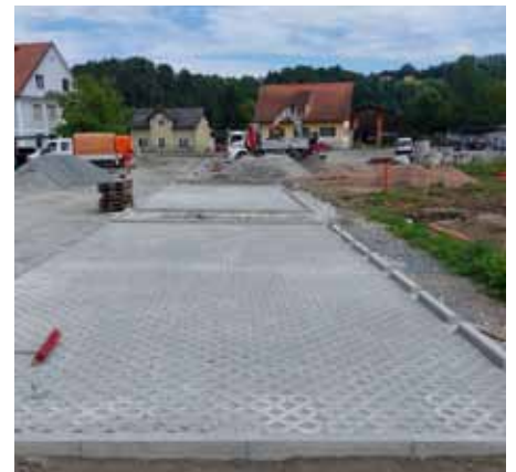
Vorbereitung der Parkplätze