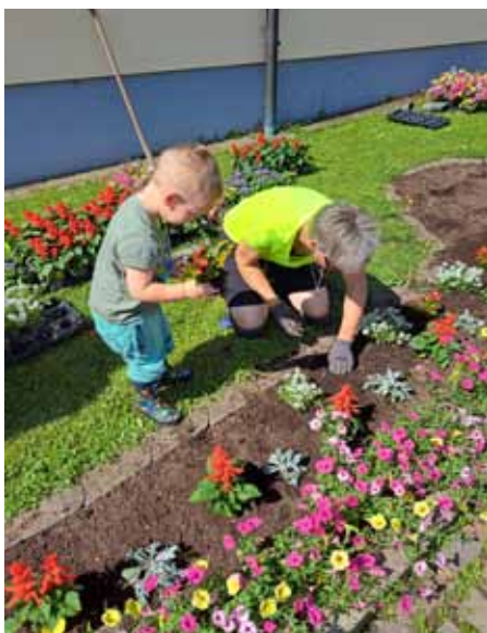
Wir helfen beim Blumen setzen