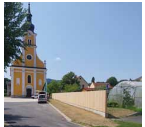
Teil der Außenanlage