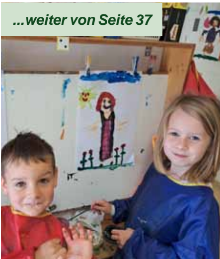
Wir zeichnen unsere Mama.

Danach rückten Muttertag und Vatertag immer näher und somit stand das Thema Familie im Mittelpunkt. Die Kinder waren ganz eifrig dabei Geschenke, Lieder und Gedichte für Mama und Papa vorzubereiten.