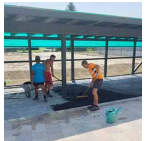
Feinschliff beim Carport